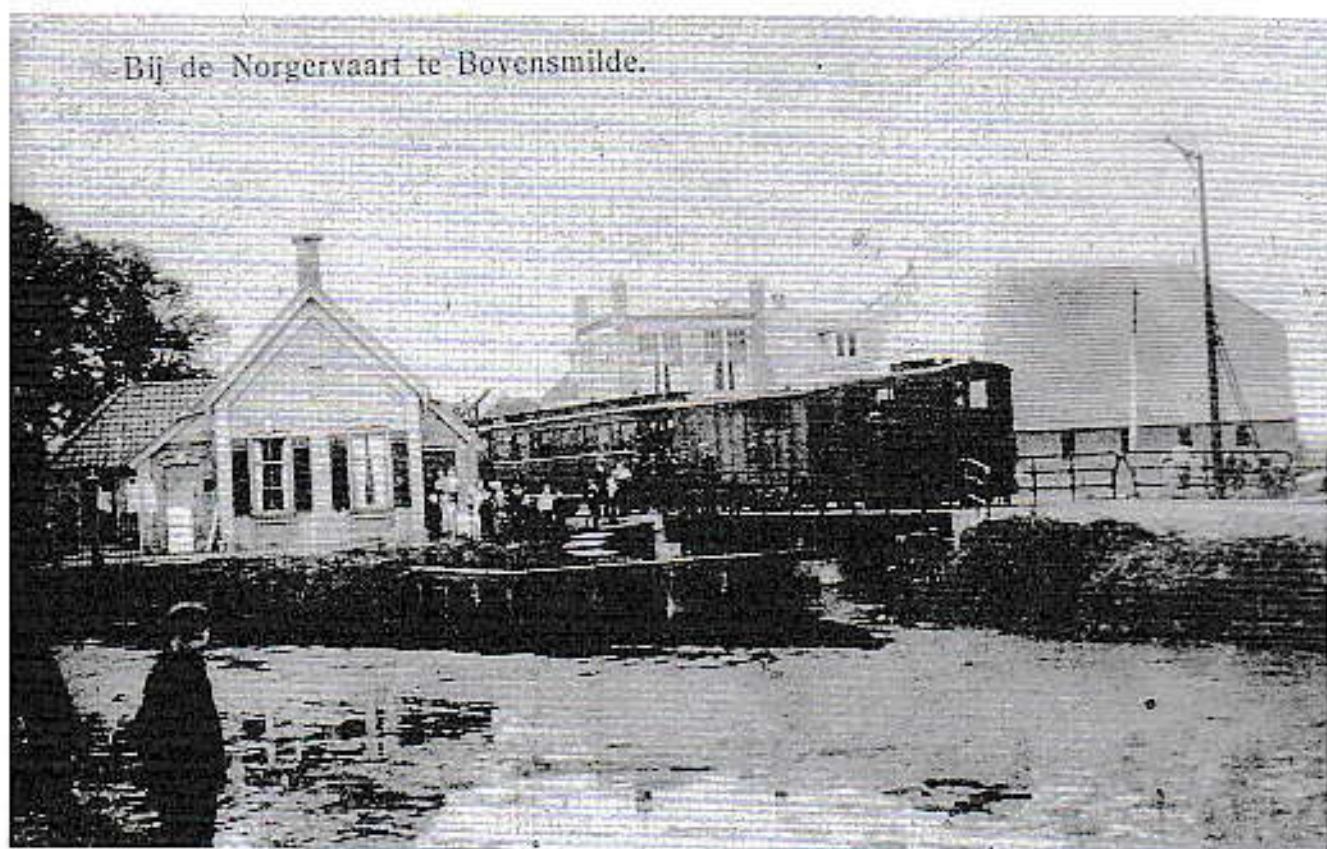
Team bij de Norgervaart.