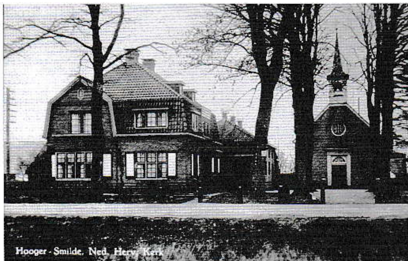
Hoogersmilde Ned. Herv. Kerk