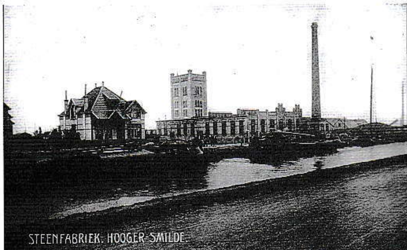
Steenfabriek Hoelfrema bv.