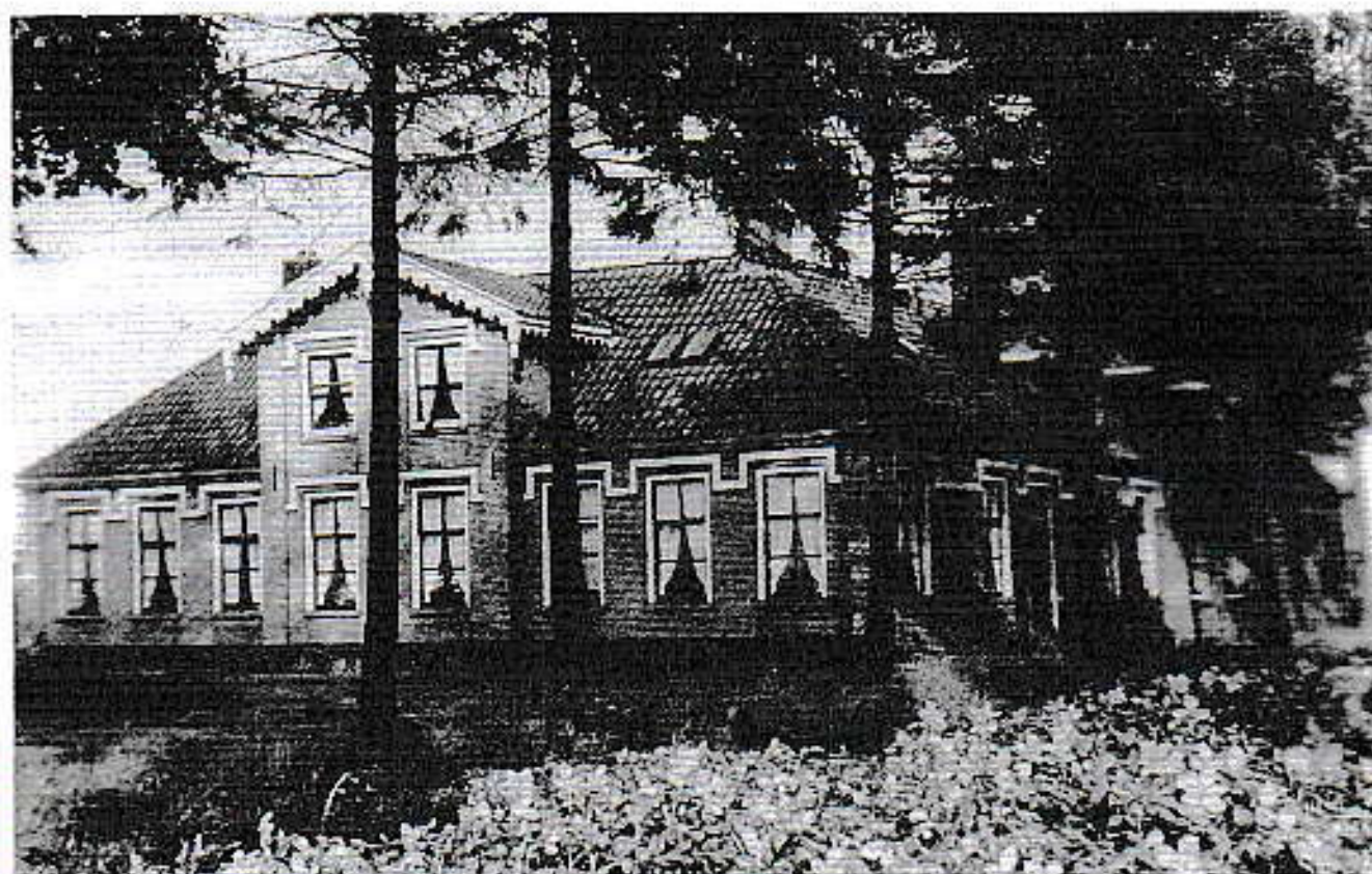
Ankersteer voorganger van Het Beurtschip