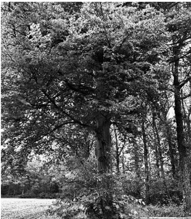
De oudste beuk en grensboom van het Hardersbos