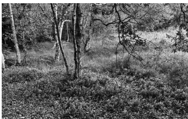
Een laatste restje bosbes

Op links een prachtige robinia, waarschijnlijk de oudste van Smilde, herkenbaar aan de sterk en diep gegroefde