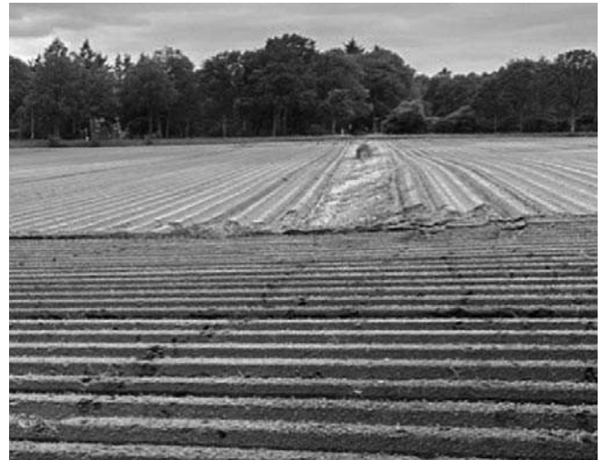
Een voormalige wijk naar verluidt gedempt met huishoudelijk afval

We steken via een van de voormalige wijken de landbouwgronden over richting de Suermondsweg. Een van de wijken zou gedempt zijn met huishoudelijk afval en inderdaad zie ik één strook waarop niets verbouwd wordt. Nooit eerder is me dat opgevallen. We zijn gelopen van het hoogste punt naar het laagste punt van Smilde. Voor het graven van de Drentse Hoofdvaart liep het water hier van oost naar west om het Kyllotsbos heen.