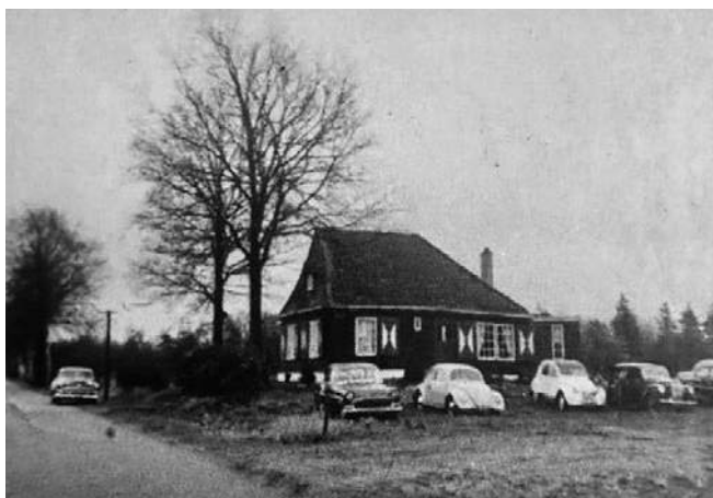
De houten woning