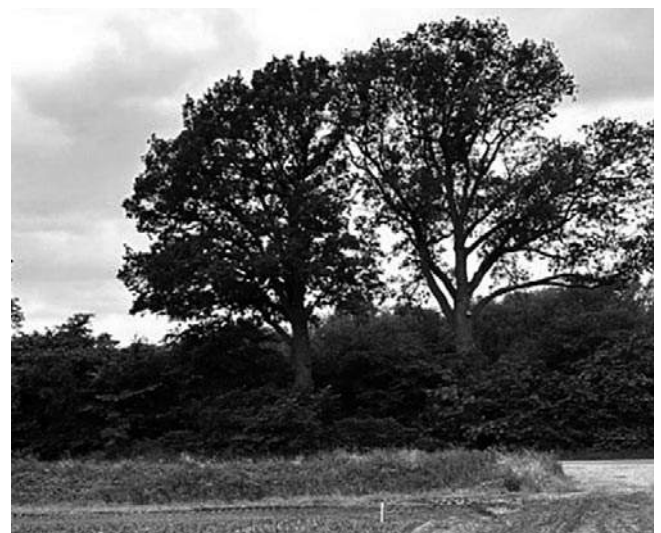
De beide eikenbomen met taxus op de voorgrond

Wij vervolgen onze weg richting het Kyllotsbos. Op rechts staat nog een restant oude sitka sparren waarvan de dikste met een omtrent van bijna 4 meter. Een sparrensoort afkomstig uit West-Amerika.