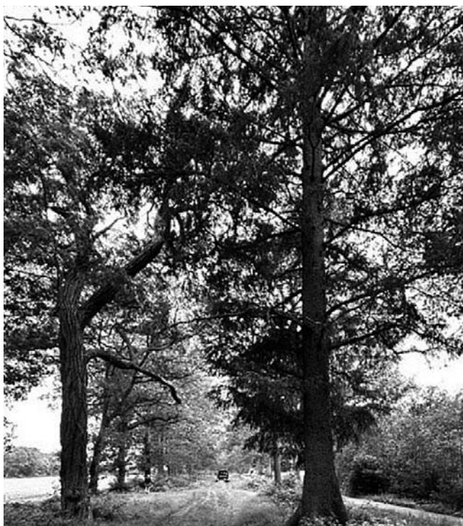
Links de robinia, rechts de sitkaspar