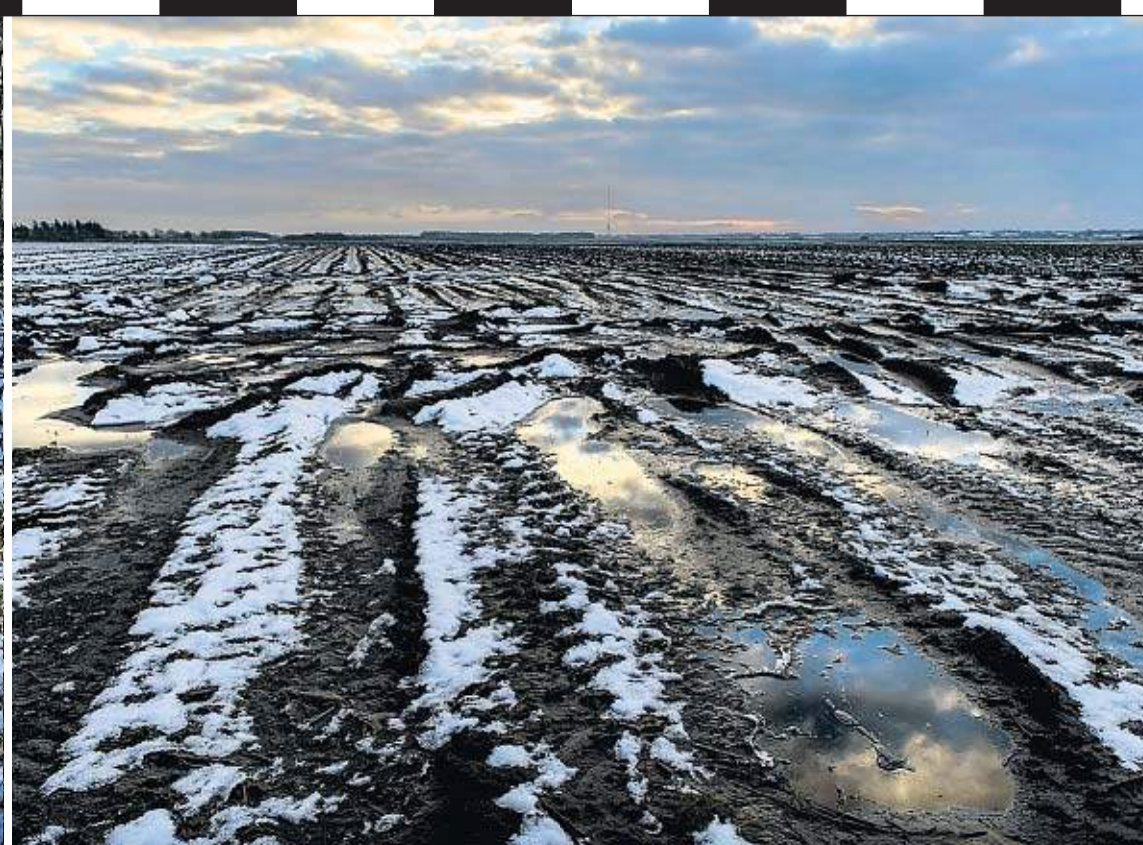
Akker in avondlicht. In de verte de zendmast van Smilde.